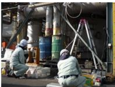
測定装置を設置している様子。