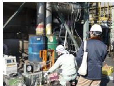
行政の担当者立ち合いのもと、測定を行っています。