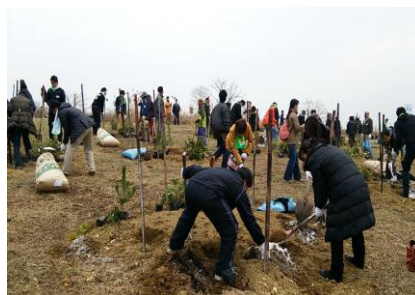
各グループに分かれて、サークル状に樹を植えていきます。

今回で11回目となるこの森づくり活動の記念植樹に、約500人の方々が参加され、5,000㎡の区域に、アラカシ、ウバメガシ、クロマツ等21種類、1,110本の苗木が植えられました。参加者は数名ずつに分かれて、それぞれのグループごとに数種類の樹をサークル状に植えていきます。そうすることによって、生育がよくなるのだそうです。これまでのイベントで植栽した面積は約60,000㎡、苗木の本数は約22,000本になったとか。今はちいさな苗木でも、おおきく育っていったら、数十年後、立派な森になってくれるといいですね。