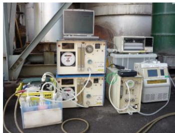
排ガス物質のモニタリングおよび測定を行う装置です。