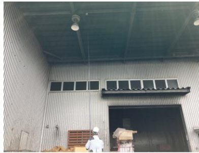
専門業者による火災報知器等の動作確認