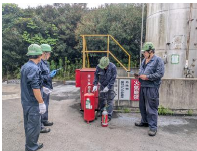
消火器の確認、緊急時対応訓練を実施

弊社におきましては、平素より事故等を起こさないよう安全な工場運転を心掛けておりますが、事前対策の一環として、火災等緊急事態が発生した場合に適切な対応が取れるよう手順書を作成し、周知しております。また、その対策マニュアルに則った消防訓練並びに、定期的な屋内外に設置している消火器・火災報知器等の点検を行っています。