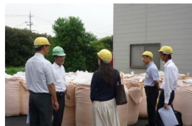
出荷前の炭をご覧いただいています

堺第7-3区内にて、大阪府環境農林水産部の新任職員の方を対象に、廃棄物リサイクル事業の一環として設立した「大阪府エコタウン」についての現地研修が行われました。弊社でも、食品系廃棄物の炭化事業についての概要をご説明し、工場施設にて食品系廃棄物の搬入から炭の生産までの工程をご覧いただきました。木炭のような形状の炭をご想像されていたとのことで、粒度の小さな炭(食品系廃棄物由来の炭)に驚かれています。