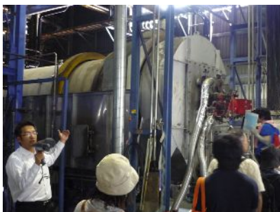
右：工場見学（炭化炉の中の様子を見ていただきました。）