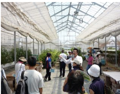
左：ハウス栽培施設見学の様子

このような取り組みを通して、子供たちの環境教育や食育などの力になればと考えています。